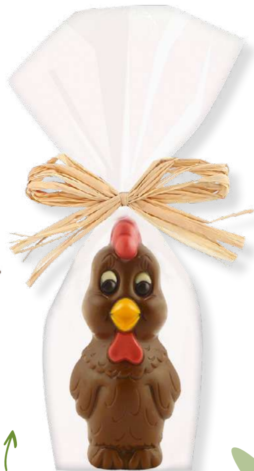
Cocotte la poule (chocolat au lait décoré) Poids : 70 g - Réf. : 1060 Dimensions : 65x50x240 mm 2,80 € TTC (2,33 € HT) soit 40 € TTC / kg