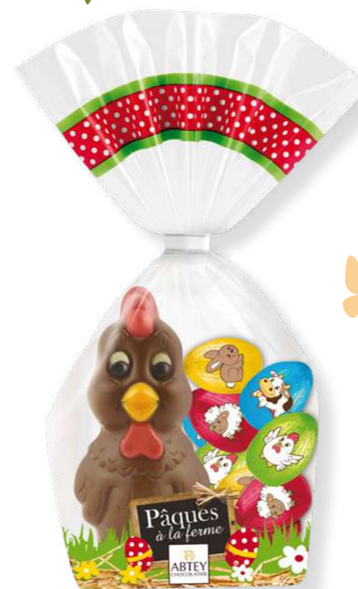
Cocotte la poule & ses 10 oeufs (chocolat au lait décoré) Poids : 130 g - Réf. : 660 Dimensions : 120x60x260 mm 4,30 € TTC (3,58 € HT) soit 33,08 € TTC / kg