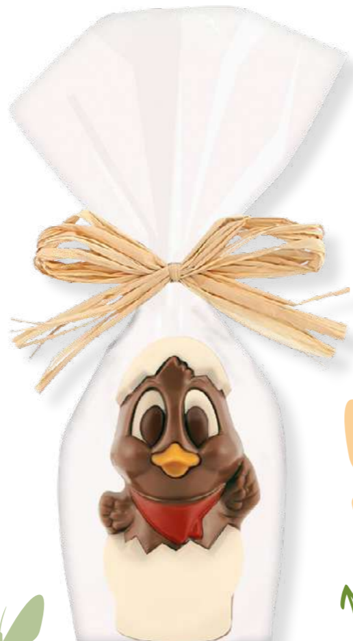
Chick le poussin (chocolat au lait décoré) Poids : 70 g - Réf. : 1129 Dimensions : 65x50x240 mm 2,80 € TTC (2,33 € HT) soit 40€ TTC / kg