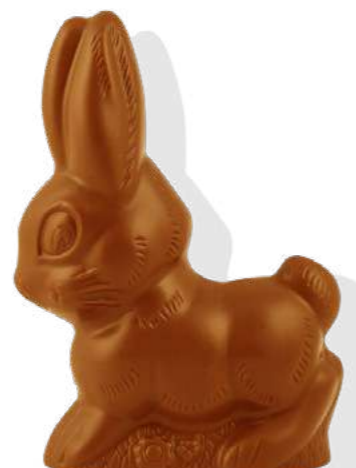
chocolat blanc coloré au goût caramel Poids : 60 g Réf. : 1128