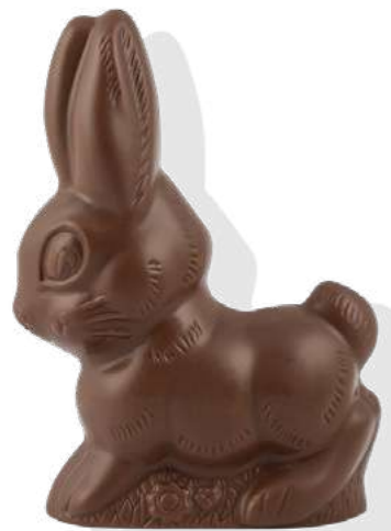
chocolat au lait Poids : 60 g Réf. : 725