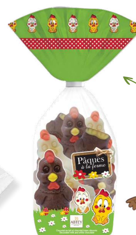
Sachet 12 Mini Cocottes (chocolat au lait et blanc décoré) Poids : 120 g - Réf. : 1255 Dimensions : 70x55x250 mm 3,90 € TTC (3,70 € HT) soit 32,50 € TTC / kg