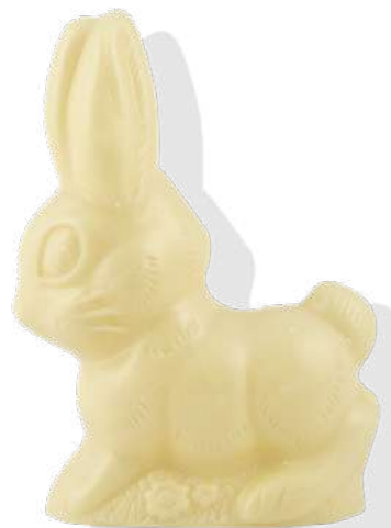
chocolat blanc Poids : 60 g Réf. : 752